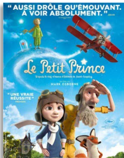
Quissac, samedi 17