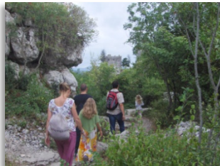
Sauve, les vendredis 23 et 30/10