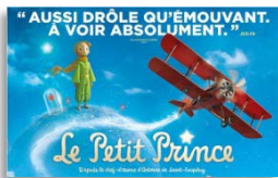
Logrian, samedi 24