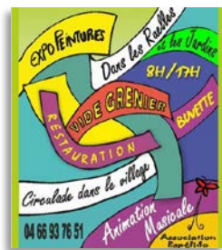
Canaule, dimanche 18

● MARDI 13 - 10h00 - CARNAS - Foyer Communal - « Le secret de Bambou-Calebasse » Conte musical pour enfant dès 4 ans - . Un petit singe quitte sa grande forêt d'Indonésie, pour un voyage initiatique à travers l'Afrique et le Brésil. Il découvre l'origine des instruments de musique... et la valeur des rencontres, avec des marionnettes musicales. Avec Jean-Baptiste Lombard, conteur et musicien Tarif jeune public – Durée : 40 mn - Tarif plein : 4,50€ - Tarif réduit : 1,50€ Contact : spectacles-cine@piemont-cevenol.fr