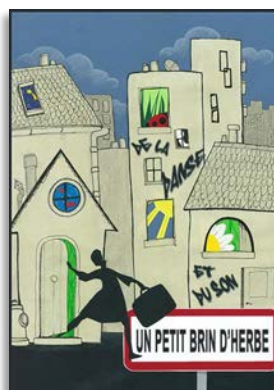
St-Hippolyte-du-Fort, vendredi 9 Quissac, samedi 10

● VENDREDI 9 - 20H30 - LEDIGNAN - Foyer - Film : « Mustang » (en VO). C'est le début de l'été, dans un village reculé de Turquie. Lale et ses quatre sœurs rentrent de l'école en jouant avec des garçons et déclenchent un scandale aux conséquences inattendues. Film réalisé par Deniz Gamze Ergüven Avec Günes Nezike Sensoy, Doga Zeynep, Doga Zeynep Doguslu, Elit Iscan Genre : Drame - Durée : 1h37 - Tarif: 4.00 € la séance. Contact : Service Spectacle vivant spectacles-cine@piemont-cevenol.fr http://www.piemont-cevenol.fr