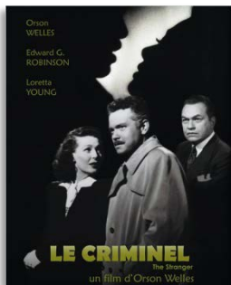
Monoblet, vendredi 23