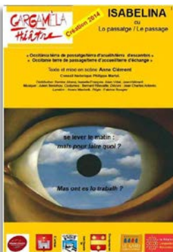
St-Hippolyte-du-Fort, dimanche 18