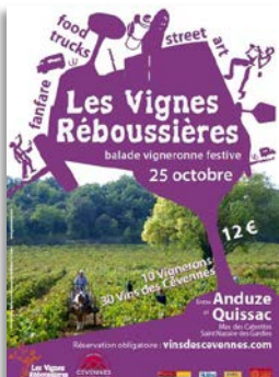
St-Nazaire-des-Gardies, dimanche 25