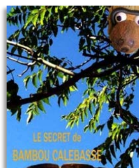
Savignargues, lundi 12

● VENDREDI 9 - 10h30 et 14h00 - ST HIPPOLYTE DU FORT - Salle des Fêtes - « Un petit brin d'herbe » : par la Cie Gai Tympan - Danse et son. Un petit brin d'herbe est né d'une rencontre entre la danse et l'univers du son. Un voyage, oscillant entre vacarme et chants d'oiseaux, réalisme et merveilleux. Tarif plein : 4,50 € - Tarif réduit : 1,50 € • Durée : 40mn • à partir de 4 ans. Avec le soutien du Conseil général du Gard Contact : Service Spectacle vivant spectacles-cine@piemont-cevenol.fr www.conduite-interieure.com