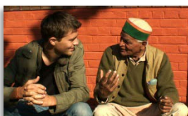
Sauve, samedi 27