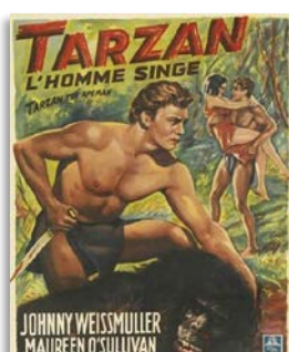
Sauve, samedi 20