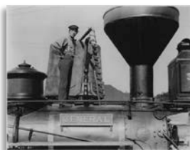
Sauve, samedi 13