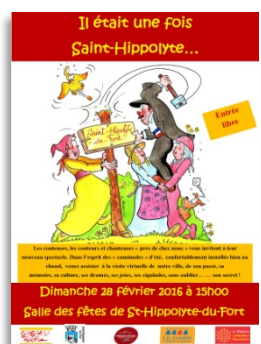
St-Hippolyte-du-Fort, dimanche 28

● SAMEDI 13 - 18h00 - SAUVE - Usine Palace - L'Usine Palace est un nouveau lieu culturel et populaire ouvert sur le partage de toutes générations - Ciné Lounge : « courts formats » Buster Keaton - Participation libre Contact : L'Usine Palace 5, place de la Vabre - Sauve Tél. 06 83 66 63 12 - palaceusine@gmail.com