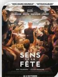
Durfort, vendredi 1er