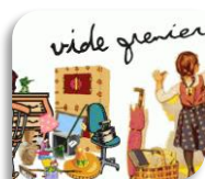
St Hippolyte du Fort, Dimanche 3