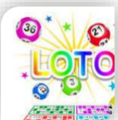
Quissac, Dimanche 3