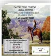
Cardet, Dimanche 3