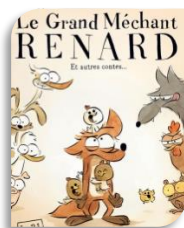
Durfort, vendredi 1er