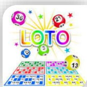
Sauve, Dimanche 17