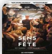
St Théodorit, samedi 2