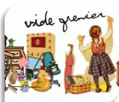
St Hippolyte du Fort, samedi 2