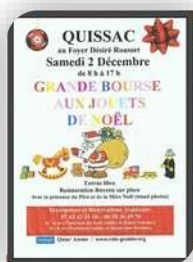
Quissac 8h à 17h, samedi 2