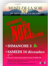
St Hippolyte du Fort, Samedi 16