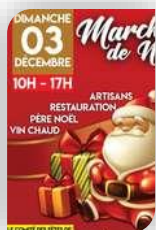
Maruéjols les Gardon, Dimanche 3